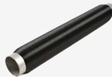
Filter and Monofilament