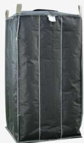
Flexible Container Bag